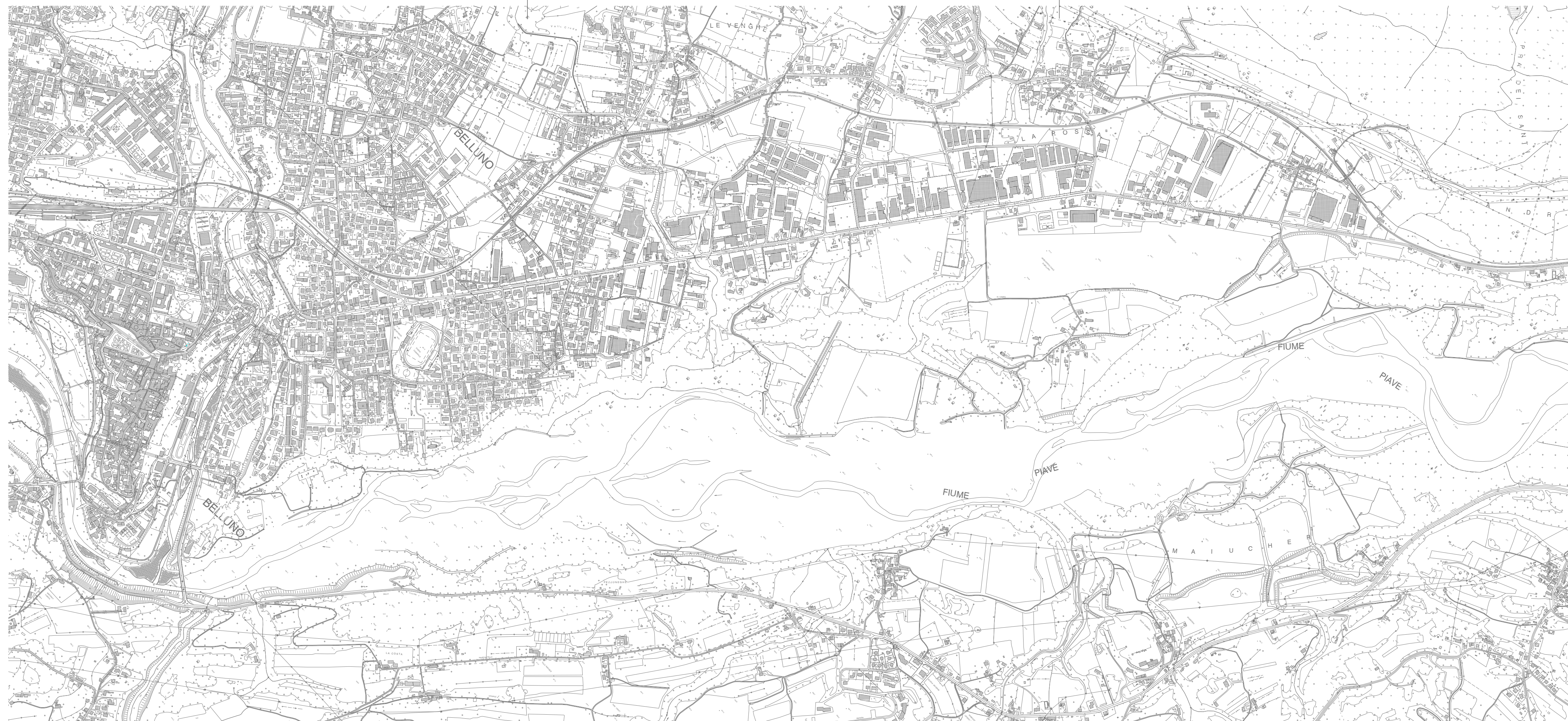
Planimetria CTR - scala 1:10.000