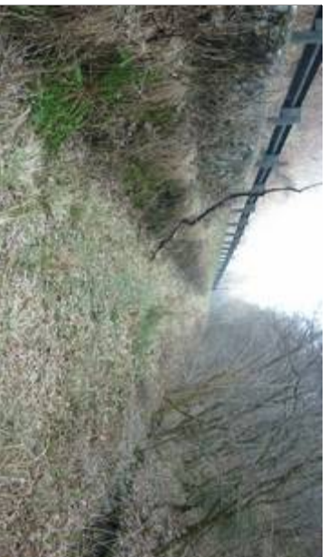
Foto 6 Tratto conclusivo con la soprastante SR203