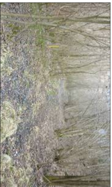
Foto 3 Tratto centrale con in evidenza la presenza di vegetazione spontanea