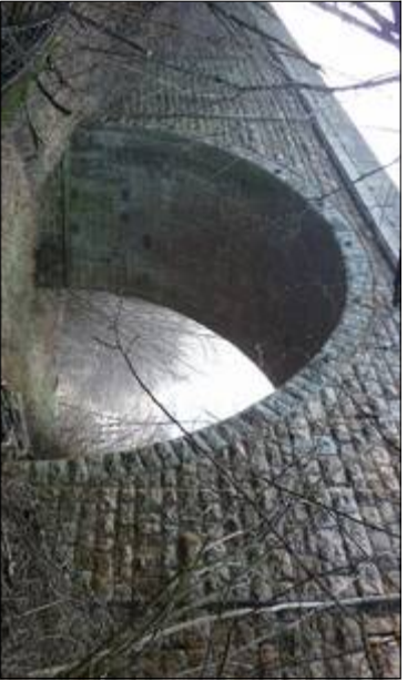
Foto 1 Tratto della pista sotto il ponte della SR203 edificato attorno al 1920