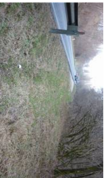
Foto 7 In prossimità dell'immissione nella SR203