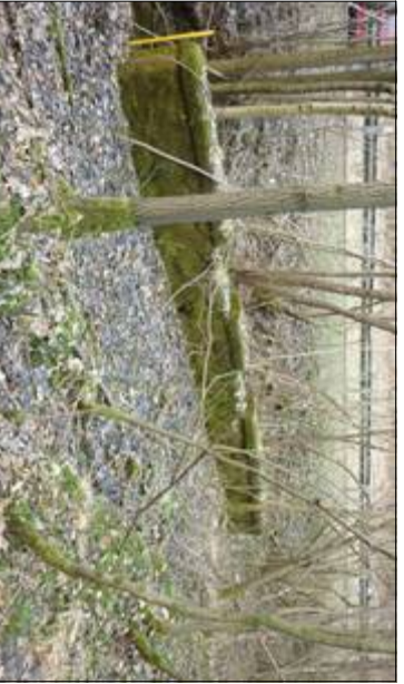
Foto 5 Ponticello in muratura