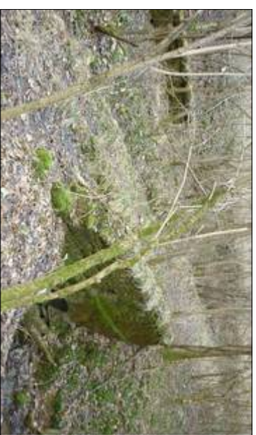
Foto 4 Ponticello in muratura