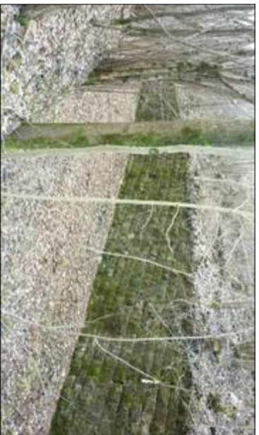
Foto 2 Tratto di pista con muro di sostegno a monte