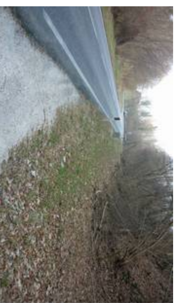
Foto 8 Sgarbo finale con la SR203 a lato