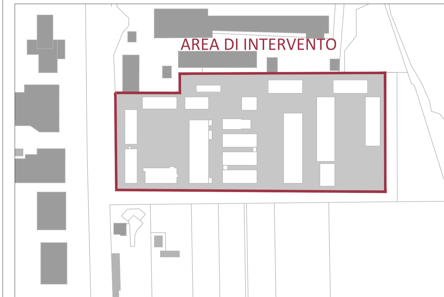
PIANTA CHIAVE_SCALE 1:2000