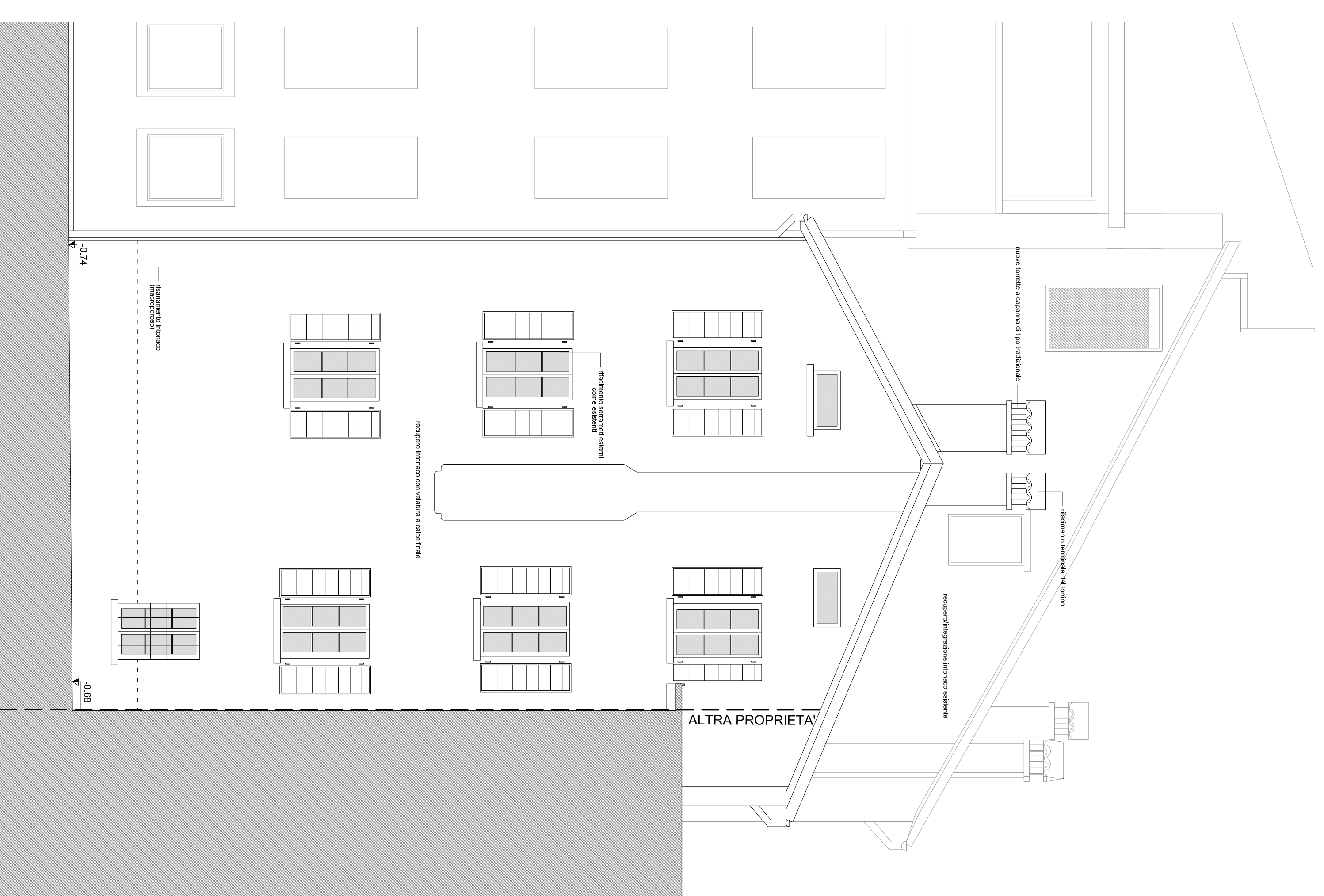
PROSPETTO SUD| VIA VICOLO TIS] _ scala 1:50

dati tecnici indirizzo Comune di Belluno via all'Industria, Ripopolazione Urban Frasso Forno progetto ADRONIA FIDELIO architettura ADRONIA FIDELIO urbanistica ADRONIA FIDELIO ingegneria ADRONIA FIDELIO ingegneria ADRONIA FIDELIO ingegneria ADRONIA FIDELIO ingegneria