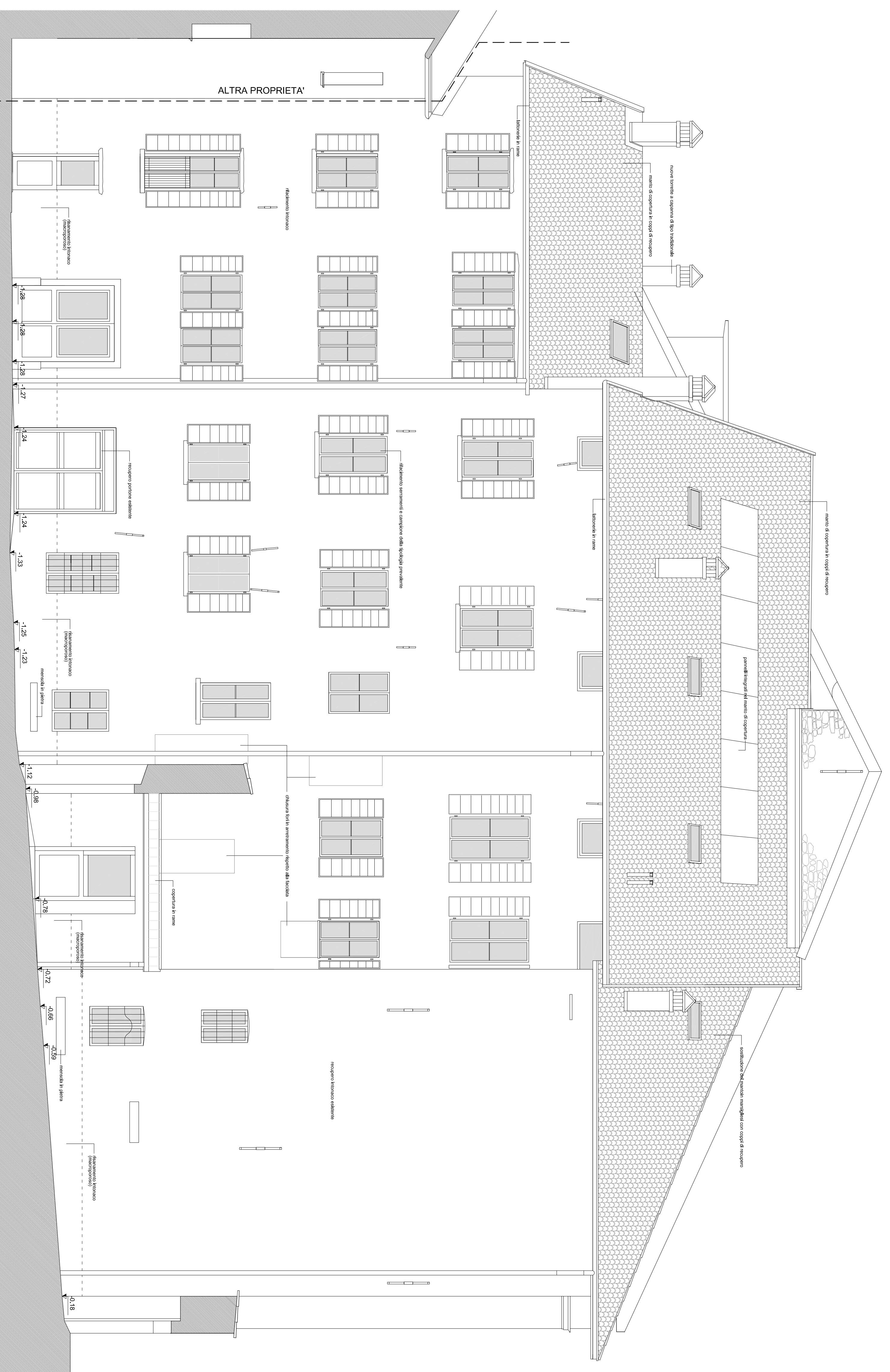
PROSPETTO EST - SEZ. A-A _ scala 1:50