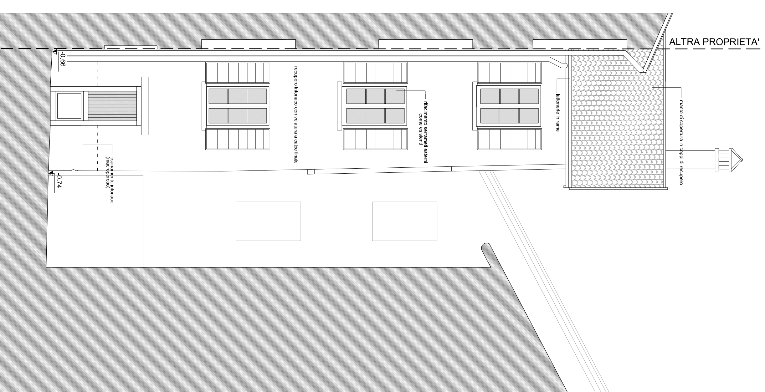
PROSPETTO OVEST VIA VICOLO TIS] _ scala 1:50