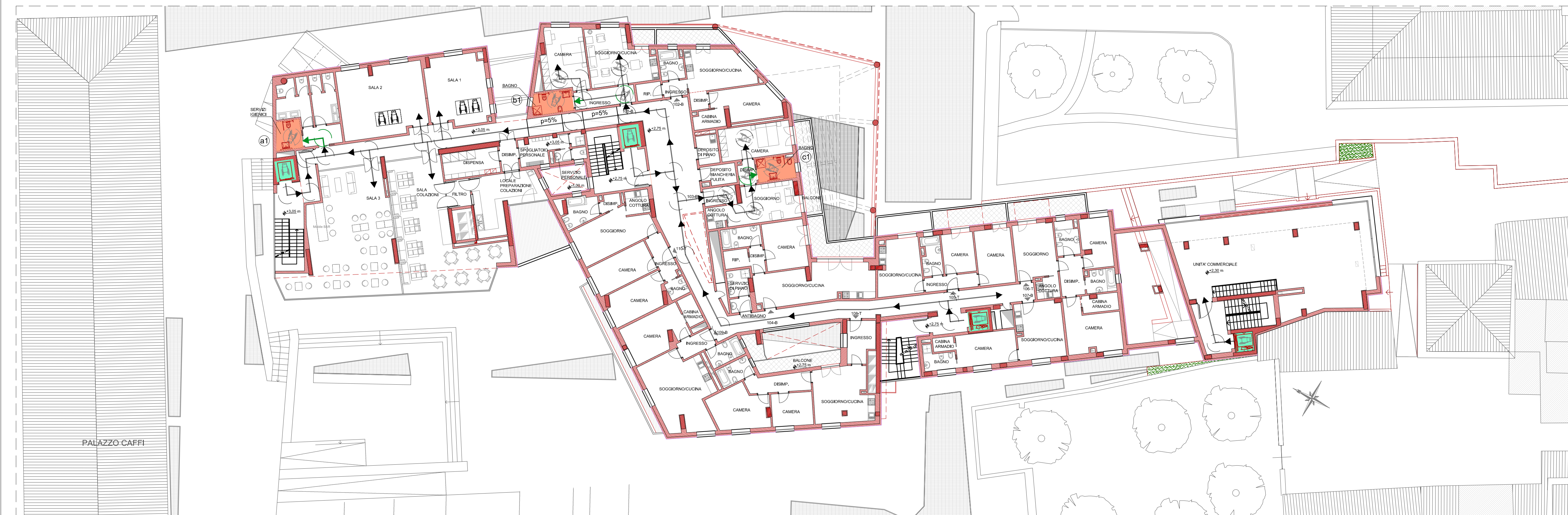
PIANTA PIANO PRIMO SCALA 1:200