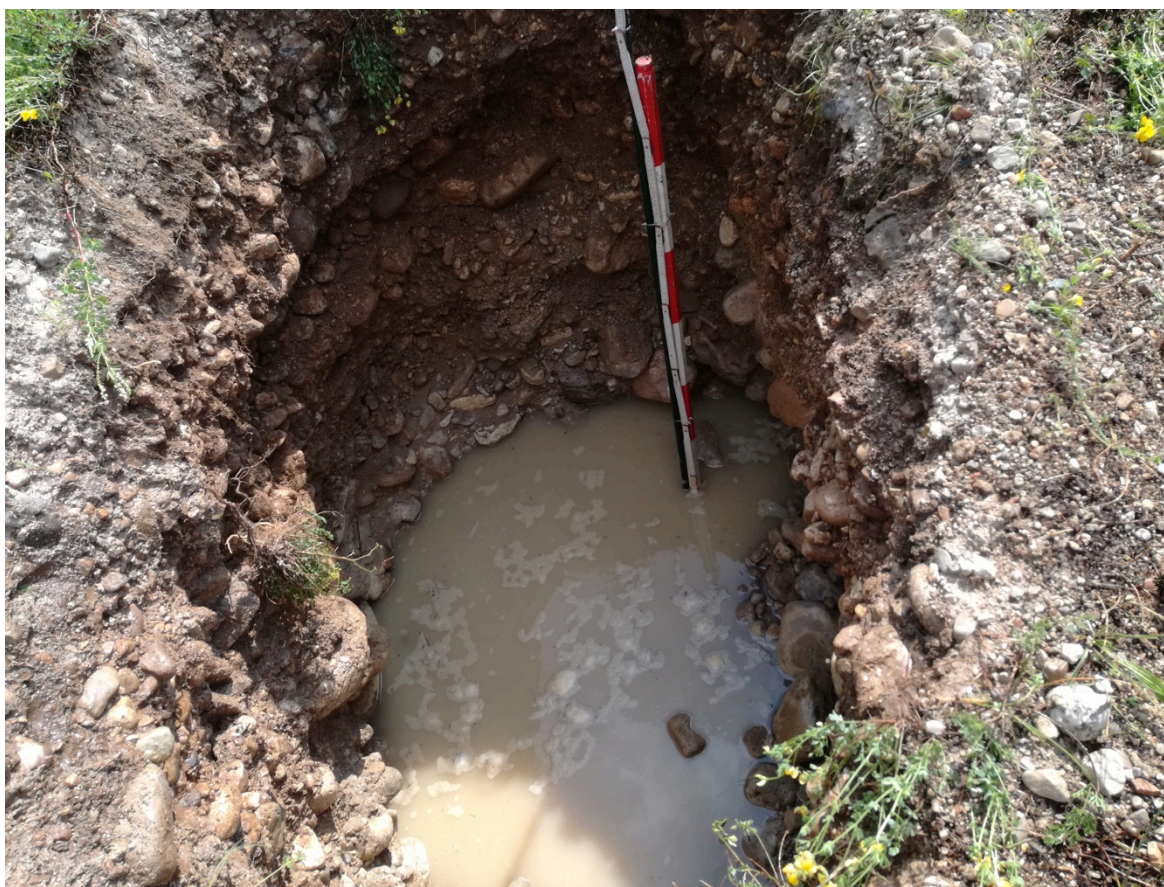
Figura 2 - Trincea di scavo durante l'esecuzione della prova.

All'interno della stessa si è eseguita una prova a carico variabile (AGI, 1977). Si è eseguito un unico gradino di portata, in quanto, l'elevata permeabilità del terreno non ha consentito un accumulo idrico sufficiente per eseguire una prova di più lunga durata.