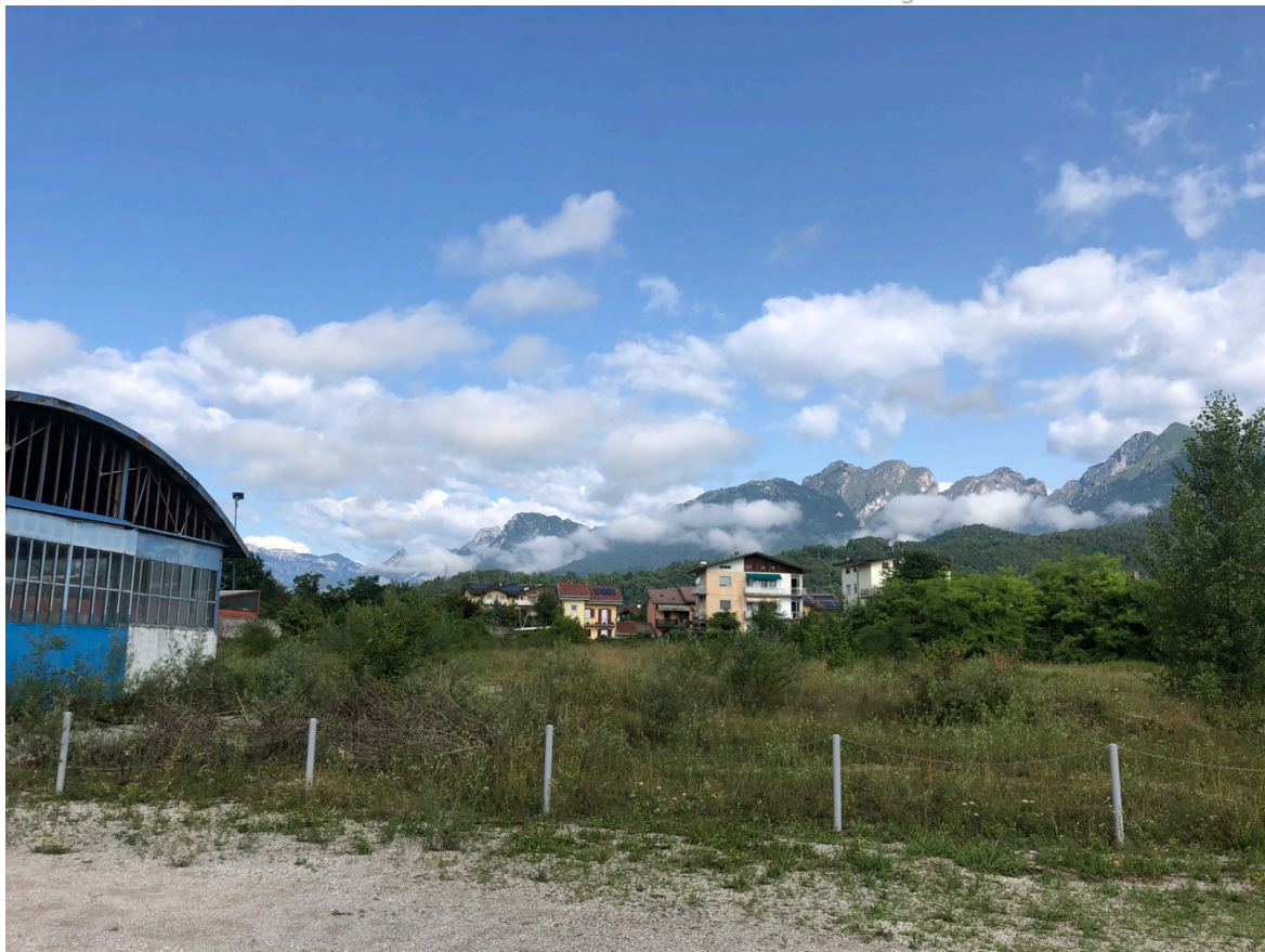
Figura 1 - Vista del sito di progetto.