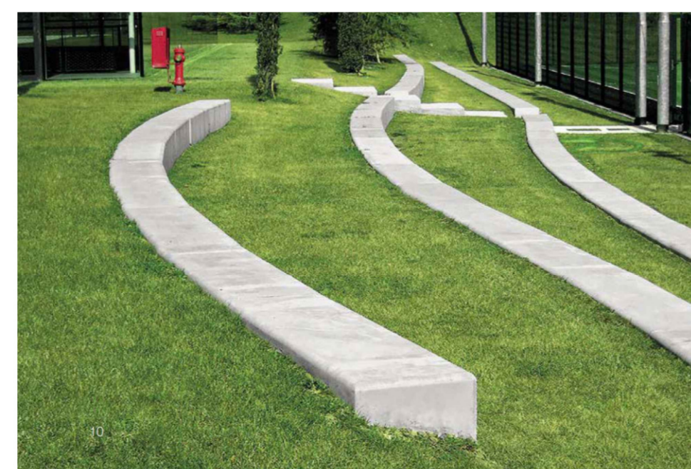
PANCHINA CURVA IN C.A.PREFABBRICATA TIPO MOD. PIAVE BUILDING

STUDI FERRARI - CANTON INGEGNERIA ARCHITETTURA URBANISTICA