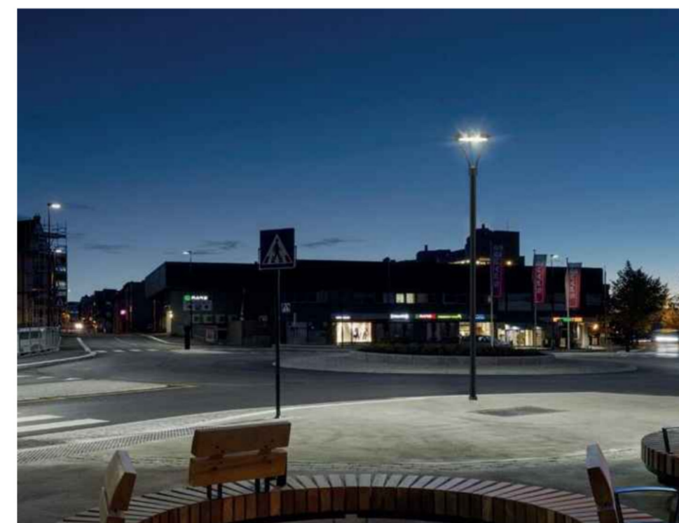
LAMPIONE URBANO h. 3,50 ml TIPO MOD. ARYA AEC Illuminazione