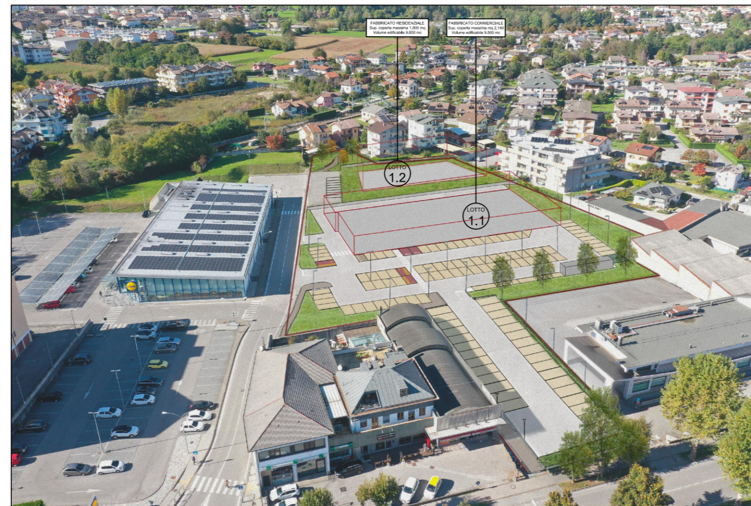
FOTOINSERIMENTO VISTA AEREA DA SUD