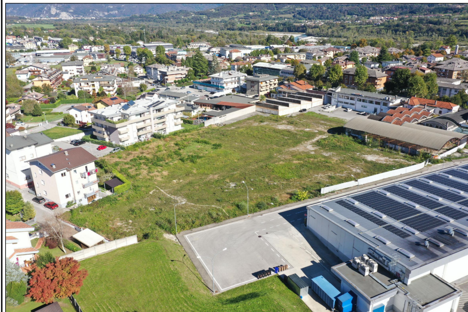
VISTA AEREA DA OVEST