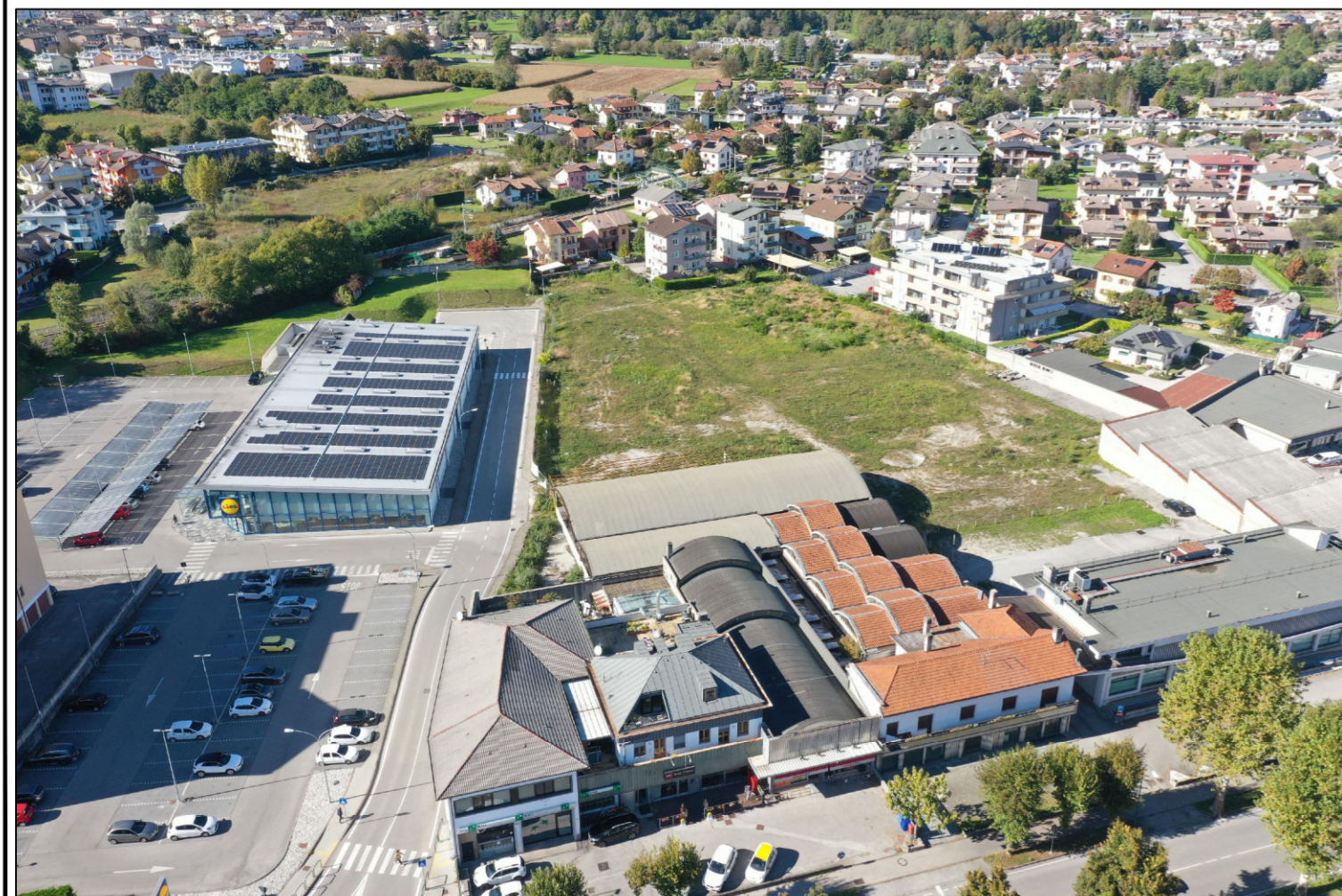
VISTA AEREA DA SUD